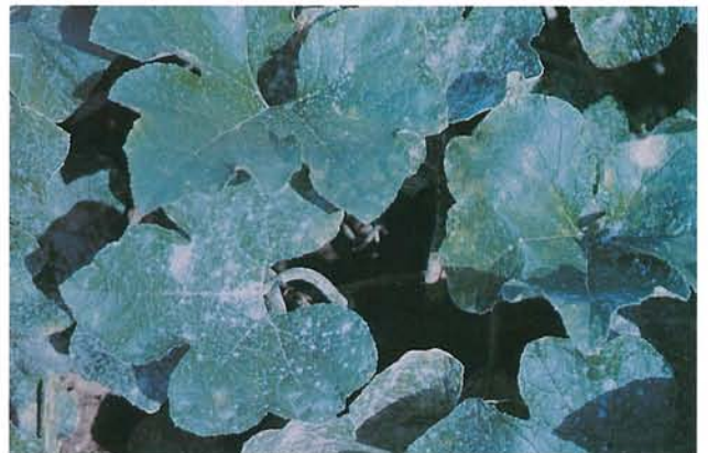
9.14 Oïdium; sur des feuilles de courge, lésions blanchâtres, semblables au talc. p. 143