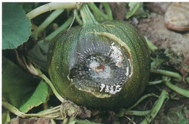
9.18 Pourriture blanche; citrouille affectée. p. 143