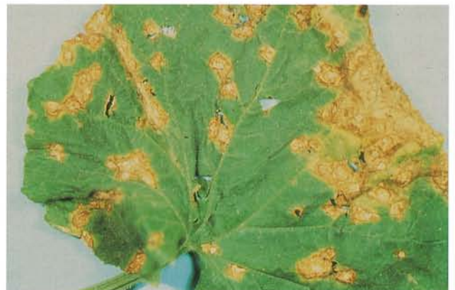
9.12 Alternariose à Alternaria ; lésions sur une feuille de concombre. p. 138