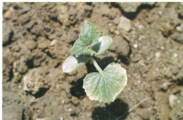
9.26 Dommages du froid; nécroses sur les cotylédons et les feuilles d'une plantule de concombre. p. 146