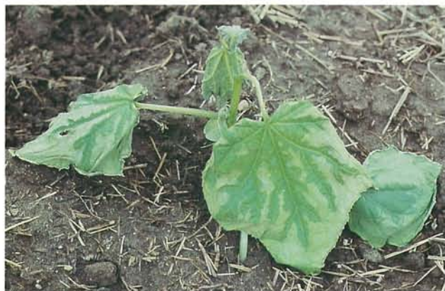
9.25 Dommages du froid; dégâts de gel chez une plantule de concombre. p. 146