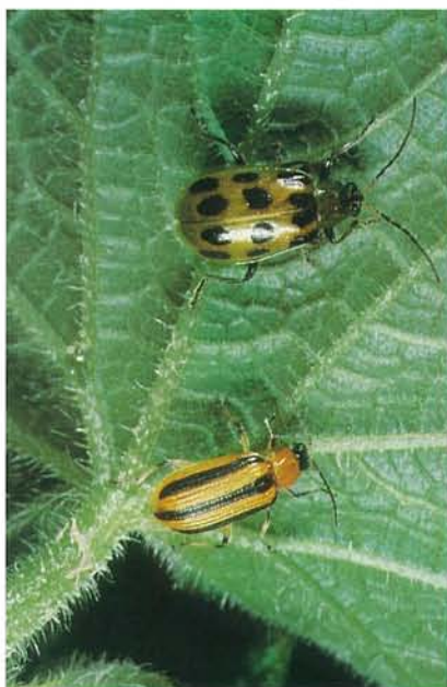
9.28 Chrysomèles du concombre; maculée (en haut) et rayée, adultes; longueur 6 à 7 mm.