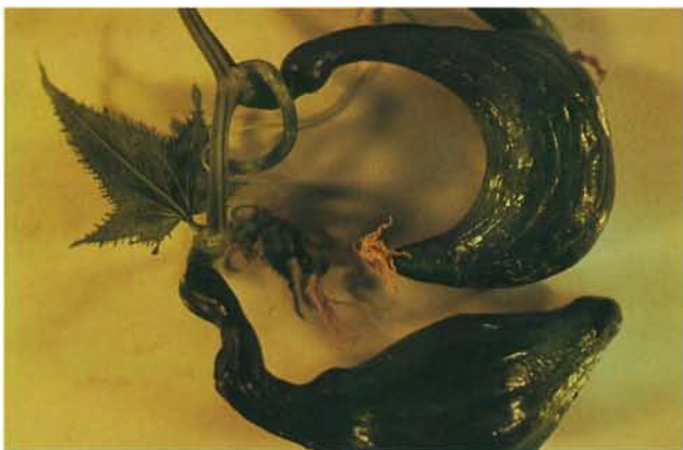
9.21 Mosaïque jaune de la courgette; concombre déformé. p. 145