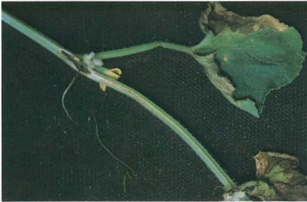
9.5 Anthracnose; lésions sur une tige et des feuilles de cantaloup. p. 138