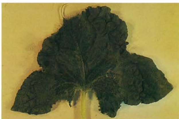
9.20 Mosaïque jaune de la courgette; feuille déformée de concombre. p. 145