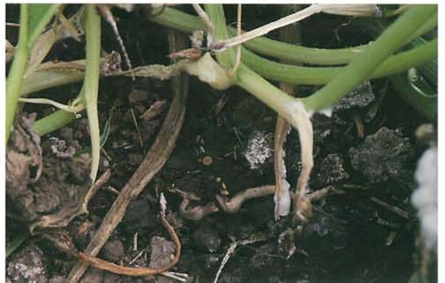
9.16 Pourriture blanche; pourriture de la tige chez la citrouille. p. 143