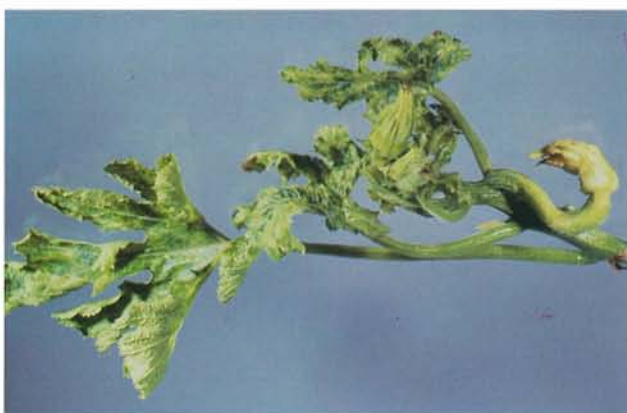
9.19 Mosaïque du concombre; forte déformation et mosaïque sur des feuilles de courgette. p. 145