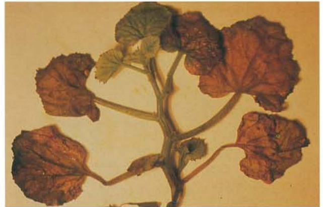
9.8 Pourriture du collet; plant de cantaloup gravement affecté. p. 145