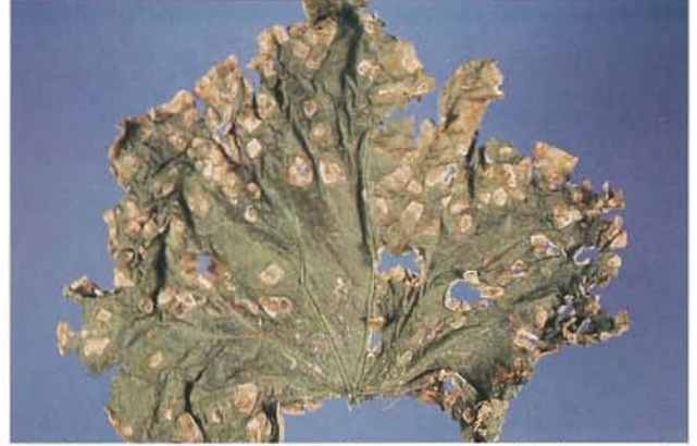
9.2 Tache angulaire; lésions et criblure sur une feuille de concombre. p. 137