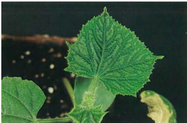
9.24 Mosaïque de la pastèque; gravure prononcée et enroulement des feuilles du concombre vers le haut. p. 146