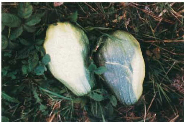
9.22 Mosaïque jaune de la courgette; légères malformations chez la courge infectée par le ZYMV. p. 145