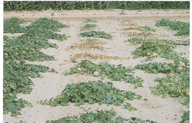
9.10 Fusariose vasculaire; plants de cantaloup sains (à gauche) et malades. p. 141