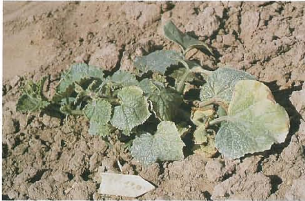
9.9 Fusariose vasculaire; plants de cantaloup affectés. p. 141