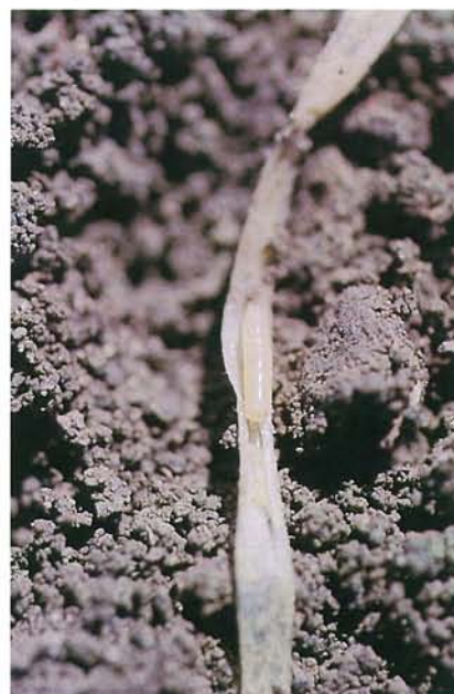
9.29 Mouche des légumineuses; larve à l'intérieur d'une tige de concombre. p. 148