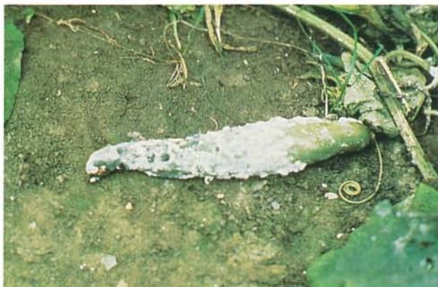
9.17 Pourriture blanche; mycélium et sclérotés du Sclerotinia sclerotiorum sur un concombre. p. 143