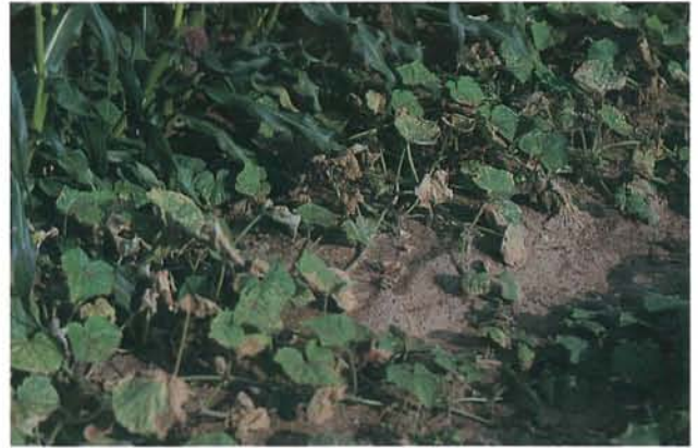
9.6 Anthracnose; chlorose généralisée et nécroses sur des feuilles de concombre. p. 138