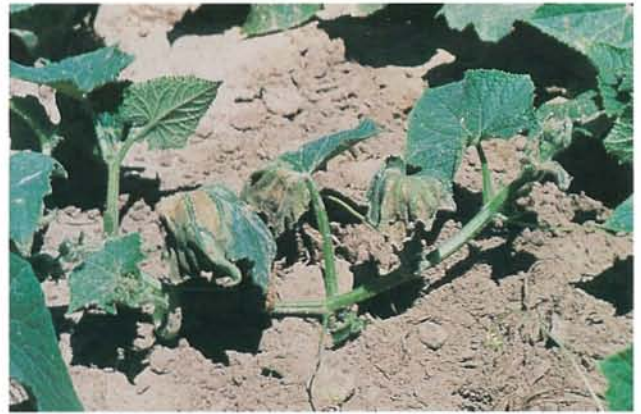
9.4 Flétrissement bactérien; tiges de concombre flétries. p. 136