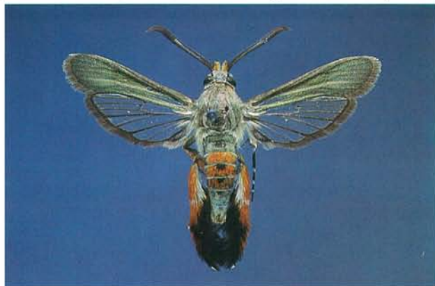
9.31 Perceur de la courge; adulte; envergure, 30 à 34 mm. p. 148