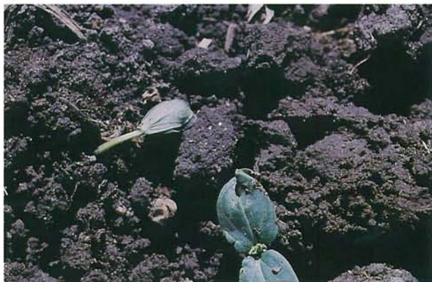
9.30 Mouche des légumineuses; plantule flétrie. p. 148