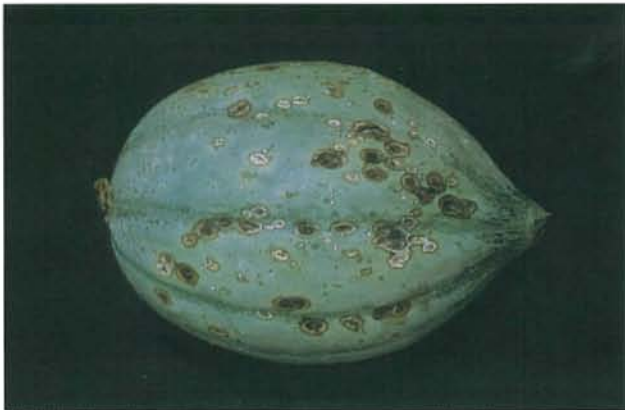
9.7 Anthracnose; lésions sur un cantaloup. p. 138