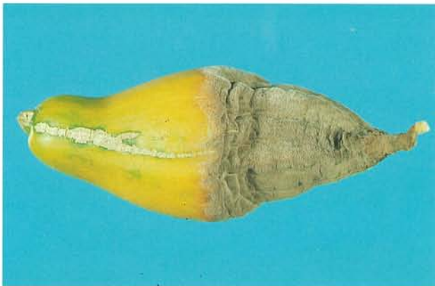
9.11 Moisissure grise; sporulation du Botrytis cinerea sur un concombre. p. 142