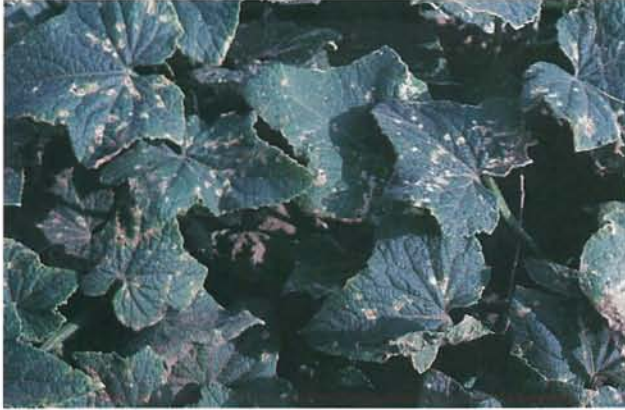
9.1 Tache angulaire; infection modérément grave chez le concombre. p. 137