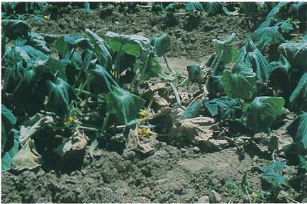
9.3 Flétrissement bactérien; plants de concombre flétris. p. 136