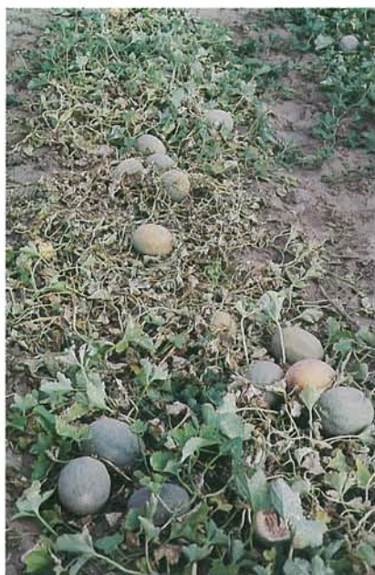
9.27 Dommages du froid; dommages dus au gel chez des plants de melon. p. 146