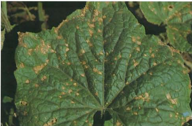
9.13 Alternariose à Ulocladium ; feuille de concombre affectée. p. 138