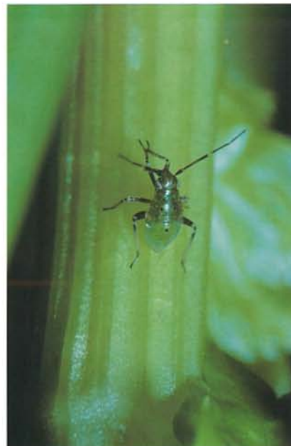
7.34 Punaise terne; larve se nourrissant. p. 99