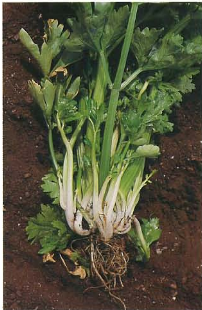
7.20 Jaunisse de l'aster; prolifération de pousses au collet. p. 95