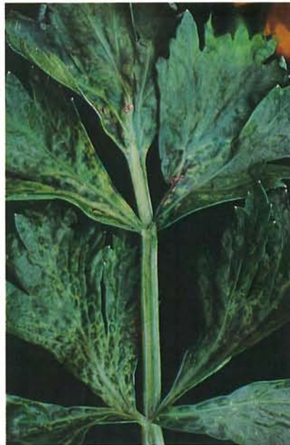
7.22 Mosaïque du coeur; symptômes de mosaïque et de gaufrage sur une feuille de céleri. p. 96