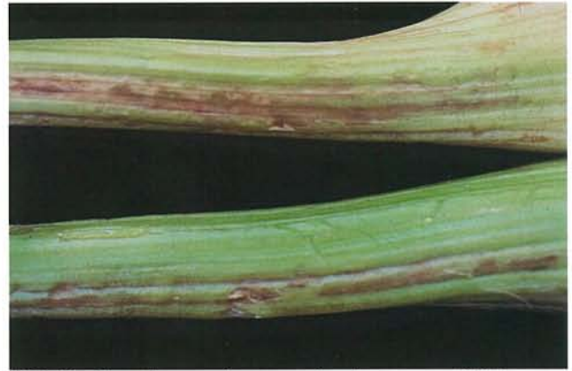
7.21 Mosaïque du coeur; longues taches brunes caractéristiques sur pétioles de céleri. p. 96