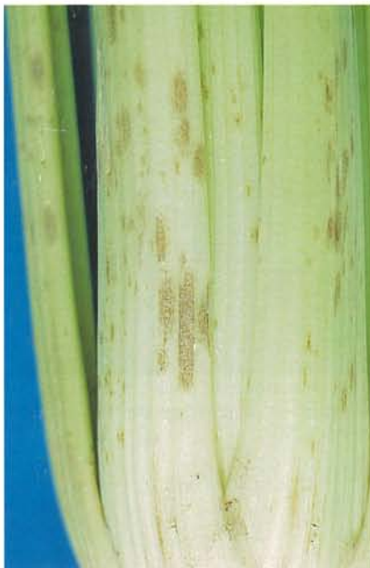
7.15 Septoriose; pycnides à l'intérieur de lésions sur des pétioles de céleri. p. 93