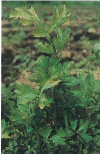
7.2 Tache bactérienne; lésions foliaires et chlorose. p. 89