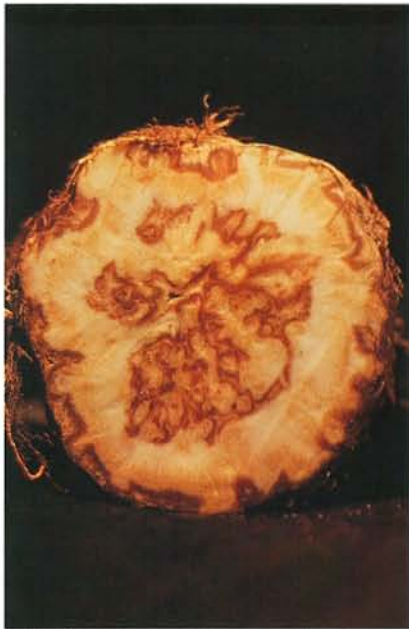
7.28 Gerçure des pétioles; pourriture interne chez le céleri-rave. p. 97