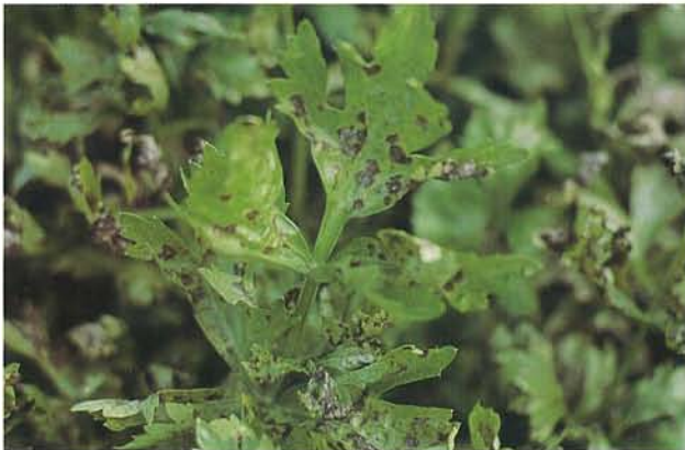
7.12 Septoriose; lésions sur des feuilles de céleri. p. 93