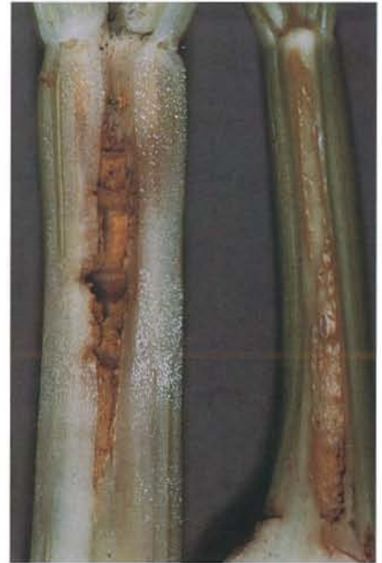
7.3 Tache brune; lésions sur la face interne d'un pétiole. p. 95