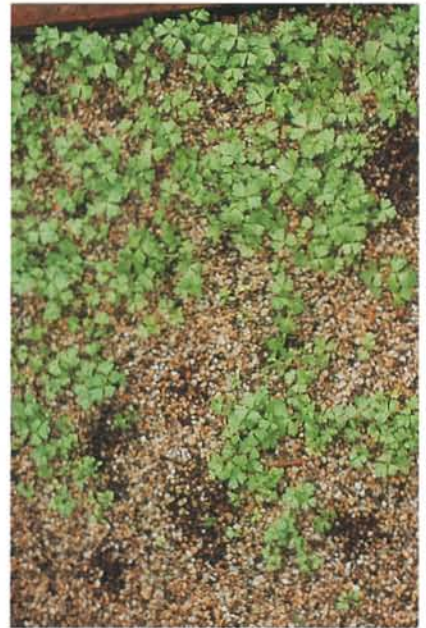
7.6 Fonte des semis; à noter l'absence de plantules dans la partie avant du plateau. p. 91