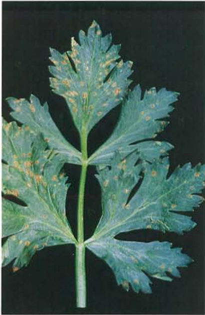
7.1 Tache bactérienne; lésions brun rouille entourées d'un halo. p. 89