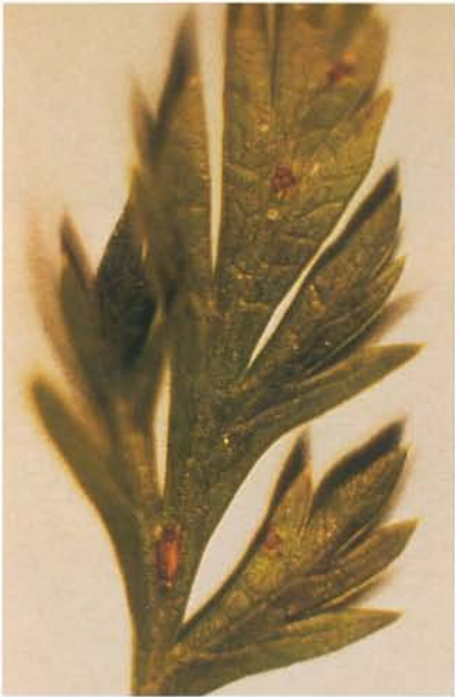
7.4 Cercosporose; lésions sur des feuilles de céleri. p. 90