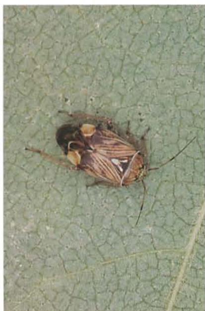
7.37 Punaise terne; adulte, spécimen pâle, longueur 5 à 6 mm. p. 99