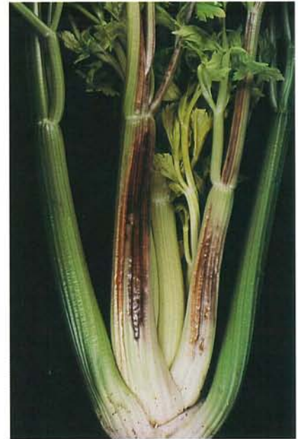
7.23 Mosaïque du coeur; nécroses sur des pétioles de céleri. p. 96