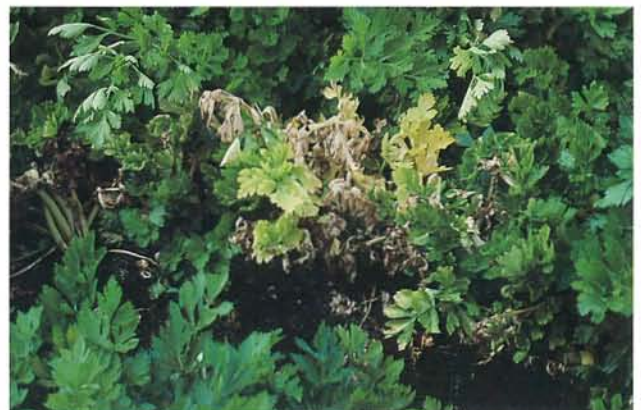
7.8 Fusariose vasculaire; dépérissement des feuilles sur des pieds de céleri. p. 91