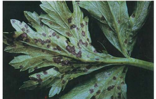
7.13 Septoriose; lésions confluentes à la face inférieure d'une foliole. p. 93