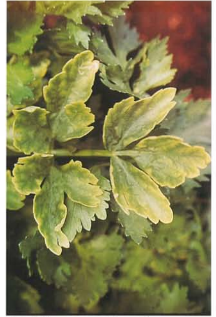
7.26 Chlorose; symptômes de carence en magnésium sur une feuille de céleri. p. 96