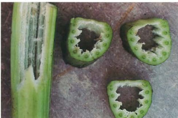
7.29 Pétiole spongieux; pétioles de céleri affectés. p. 97