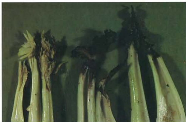
7.35 Punaise terne; pourriture résultant de dommages d'alimentation à l'intérieur de pétioles. p. 99