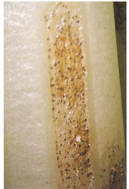
7.16 Septoriose; pycnides à l'intérieur d'une lésion (agrandie). p. 93