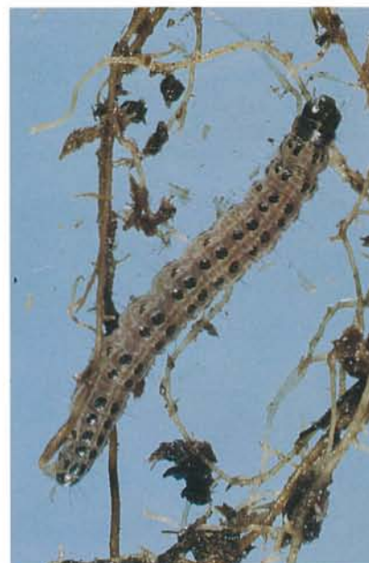
7.39 Pyrale du céleri; larve; dimensions réelles 25 mm. p. 100