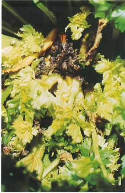
7.24 Coeur noir; plant de céleri affecté. p. 96