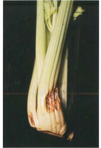
7.11 Sclérotiniose; coloration rosâtre caractéristique d'une lésion. p. 93