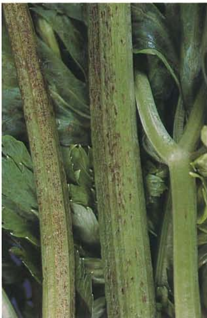
7.14 Septoriose; lésions sur des pétioles de céleri. p. 93