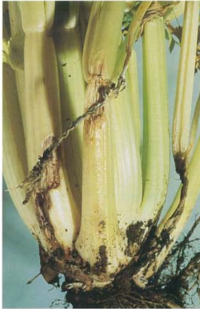
7.10 Sclérotiniose; lésions sur des pétioles de céleri. p. 93