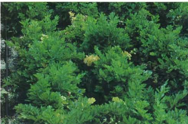
7.7 Fusariose vasculaire; chlorose des feuilles externes chez le céleri. p. 91