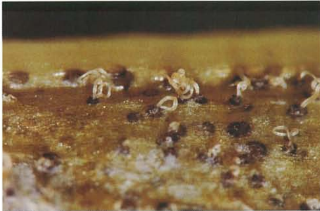
7.17 Septoriose; cirrhes de spores à l'intérieur de pycnides. p. 93