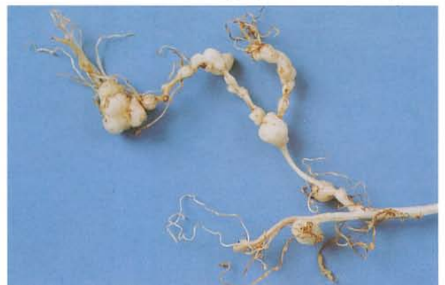
7.31 Nématode cécidogène du nord; galles sur les racines. p. 98