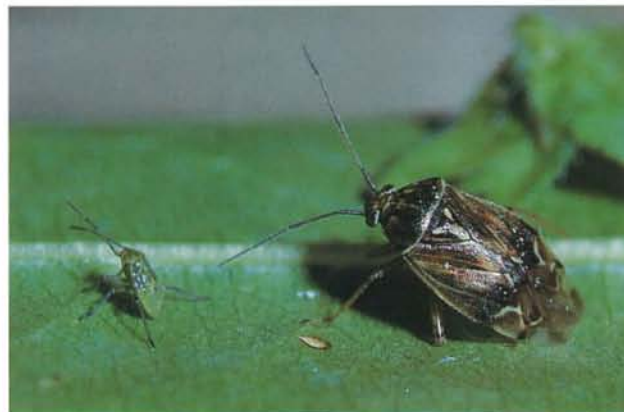
7.36 Punaise terne; adulte (à droite), longueur 5 à 6 mm; et jeune larve. p. 99