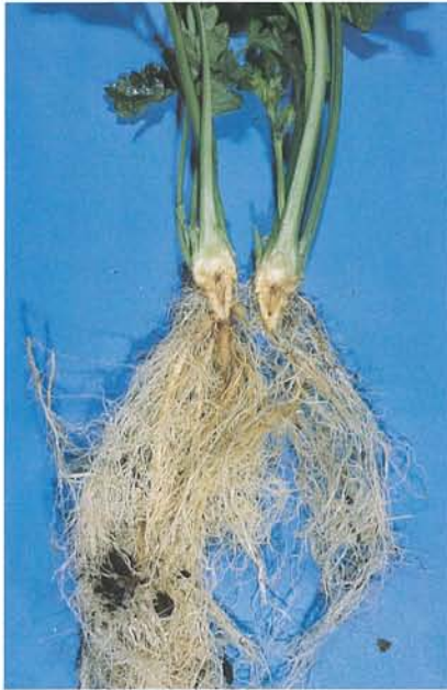
7.9 Fusariose vasculaire; coloration brun rougeâtre des tissus internes du collet. p. 91