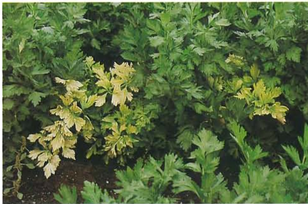
7.19 Jaunisse de l'aster; symptômes foliaires chez le céleri. p. 95