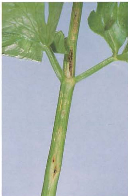
7.33 Punaise terne; dommages d'alimentation sur un pétiole de céleri. p. 99