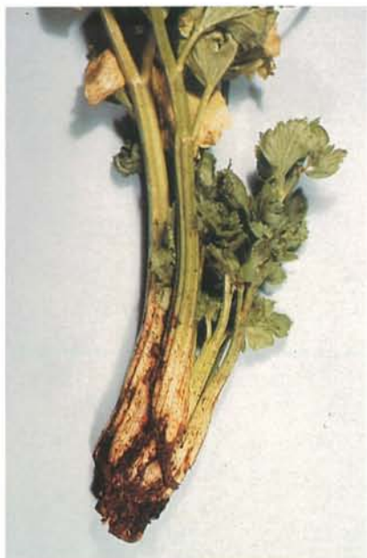
7.32 Charançon de la carotte; graves dégâts à la racine et au collet d'un pied de céleri. p. 98