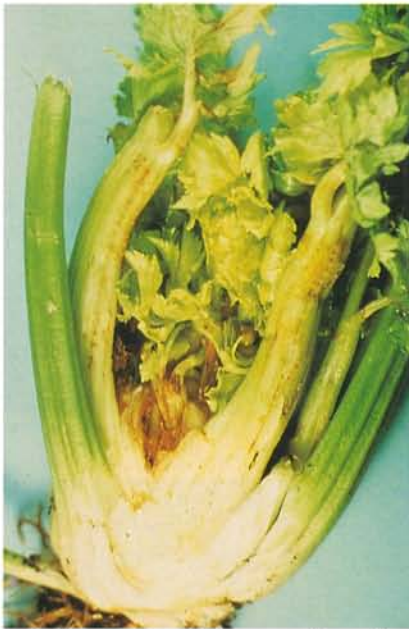
7.27 Gerçure des pétioles; symptômes chez le céleri. p. 97