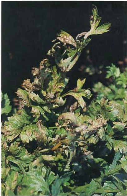
7.5 Cercosporose; symptômes modérés chez le céleri. p. 90