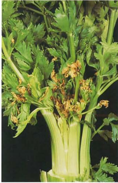
7.25 Coeur noir; symptômes foliaires chez le céleri. p. 96