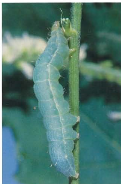
7.38 Autographe du céleri; larve; la ligne latérale est plus étroite que chez la fausse-arpenteuse; dimensions 28 mm. p. 100