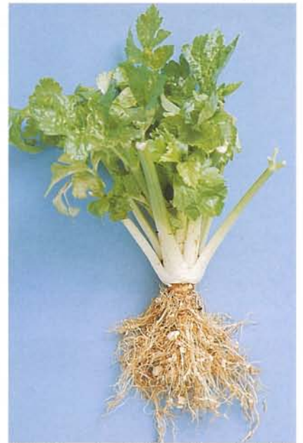
7.30 Nématode cécidogène du nord; pied de céleri rabougri; galles sur les racines. p. 98