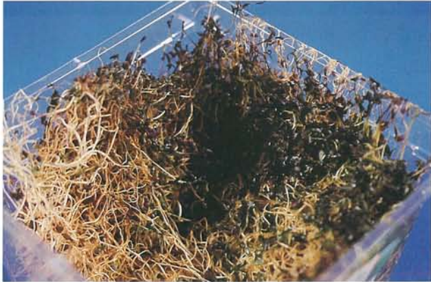
27.1 Pourriture molle des germes de luzerne; une pourriture se propage rapidement et détruit les germes. p. 416