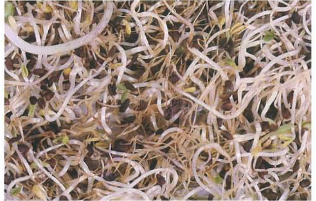
27.2 Pourriture molle des germes de luzerne; la pourriture commence par une translucidité jaunâtre des racines. p. 416