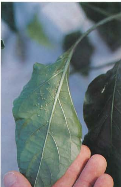
24.11 Puceron vert du pêcher; feuille de poivron infestée. p. 370