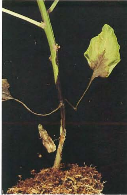
24.2 Pourriture noire fusarienne; infection précoce de la tige au niveau d'un noeud. p. 366