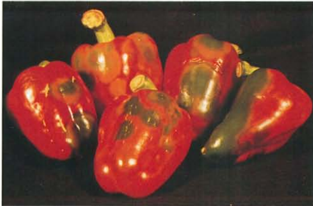
24.9 Maladie bronzée de la tomate; lésions annulaires et maturation inégale du fruit. p. 367