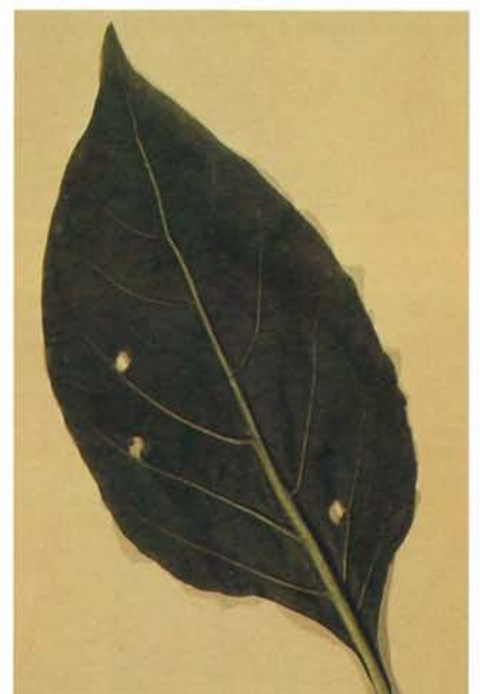
24.16 Anthonome du poivron; dommages d'alimentation d'un adulte. p. 369