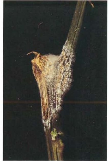
24.3 Pourriture noire fusarienne; mycélium et périthèces ( Nectria ) sur un chancre. p. 366