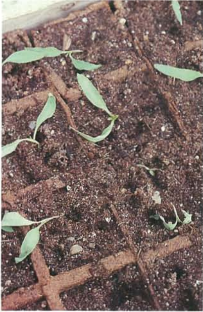
24.1 Fonte des semis; plantules flétries. p. 365