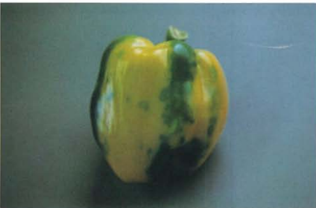
24.6 Marbrure bénigne du poivron; marbrure sur un poivron. p. 367