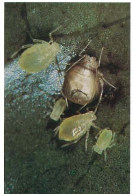
24.13 Puceron vert du pêcher; adulte momifié, parasité par une guêpe. p. 370