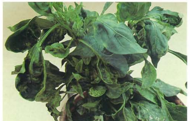
24.8 Maladie bronzée de la tomate; marbrure, déformation et rosettes foliaires. p. 367