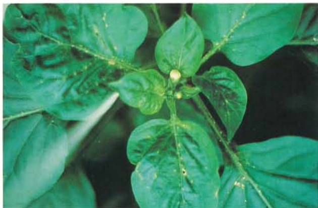
24.21 Thrips des petits fruits; dégâts au bourgeon apical causant la malformation de la feuille. p. 371