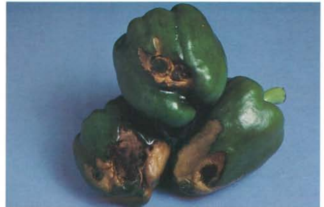
24.10 Nécrose apicale; lésions déprimées sur des fruits; voir aussi 18.49 et 18.50. p. 369