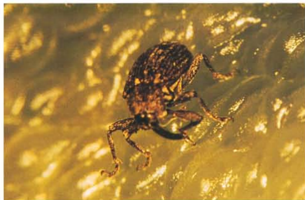
24.20 Anthonome du poivron; adulte; longueur 2,5 à 3,1 mm. p. 369