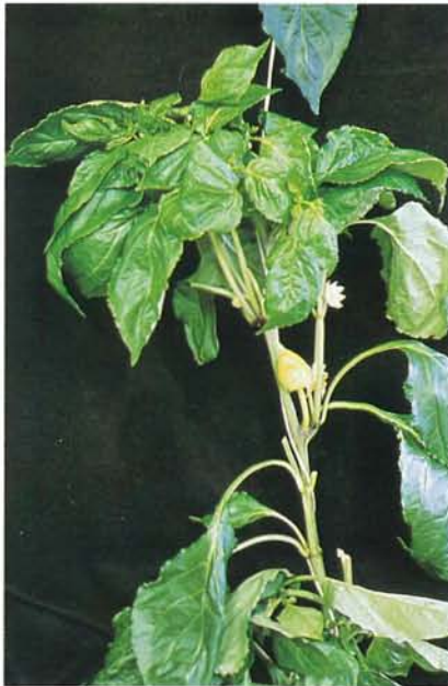
24.5 Marbrure bénigne du poivron; marbrure des jeunes feuilles. p. 367