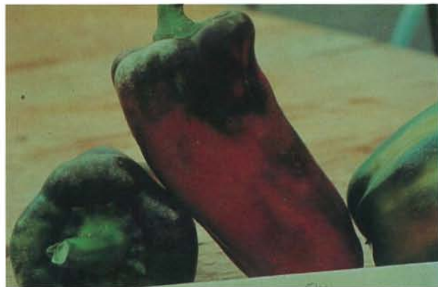
24.22 Thrips des petits fruits; dégâts sur un fruit, sous et autour du calice, exposant le fruit à l'infection bactérienne. p. 371