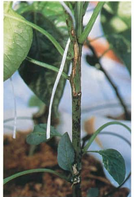
24.7 Maladie bronzée de la tomate; lésions nécrotiques sur la tige. p. 367