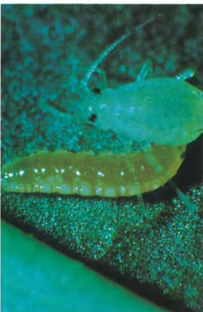
24.14 Cécidomyie prédatrice, Aphidoletes sp.; larve attaquant un puceron. p. 370