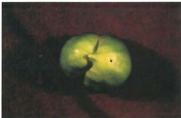
24.17 Anthonome du poivron; trou laissé par un adulte en sortant d'un jeune fruit. p. 369