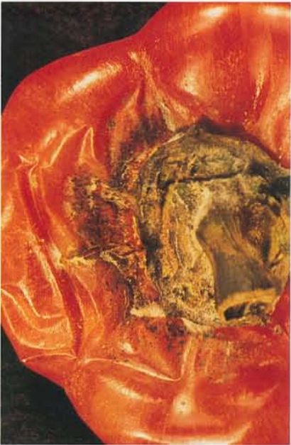
24.4 Pourriture noire fusarienne; pourriture du fruit avec des périthèces du Nectria . p. 366