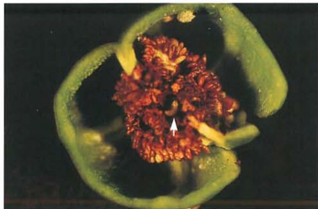
24.18 Anthonome du poivron; dégâts sur un fruit; à noter les graines brunies et la larve dans la cavité creusée par celle-ci (au centre). p. 369