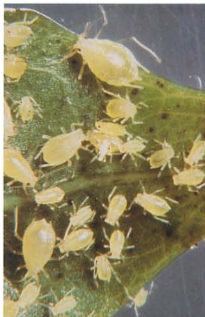
24.12 Puceron vert du pêcher; adultes aptères, larves et exuvie (au centre). p. 370