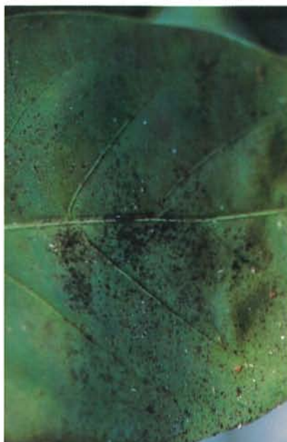
24.15 Fumagine croissant sur du miellat de puceron. p. 370