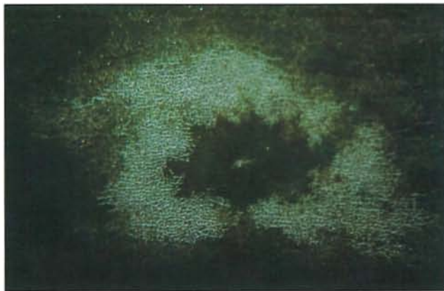
24.23 Thrips des petits fruits; cicatrice de ponte et «tache fantôme» sur un fruit. p. 371