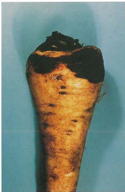
14.1 Chancre à Itersonilia ; lésion à l'épaulement d'un panais. p. 219