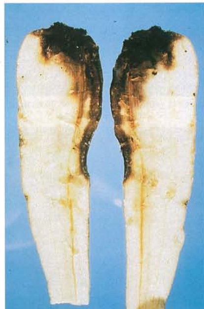
14.7 Phoma du panais; lésion à l'épaulement et au collet d'un panais. p. 220