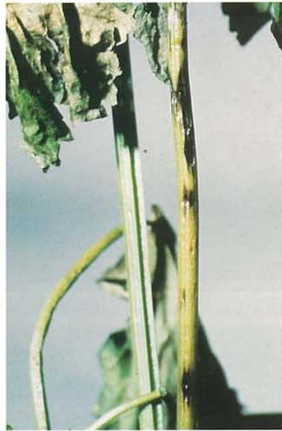
14.4 Phoma du panais; lésions foliaires nécrotiques et chancres sur les pétioles. p. 220