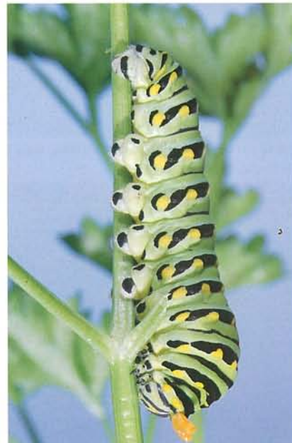
14.8 Papillon du céleri; larve à maturité montrant ses glandes odoriférantes déployées. p. 222