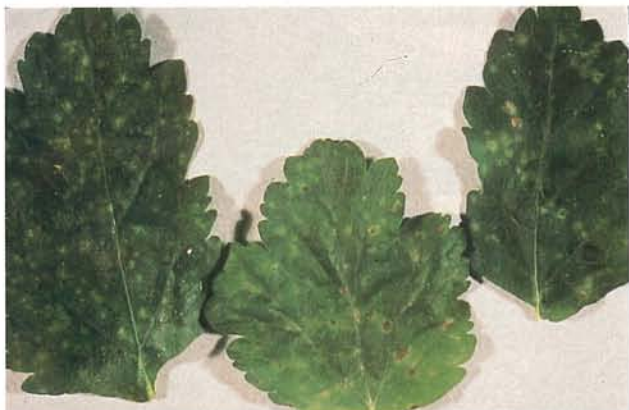
14.3 Chancre à Itersonilia ; lésions foliaires nécrotiques brunes entourées de halos vert pâle. p. 219