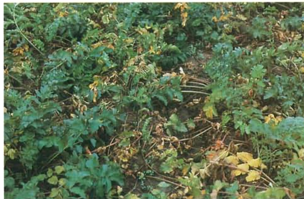
14.5 Phoma du panais; symptômes de brûlure foliaire. p. 220