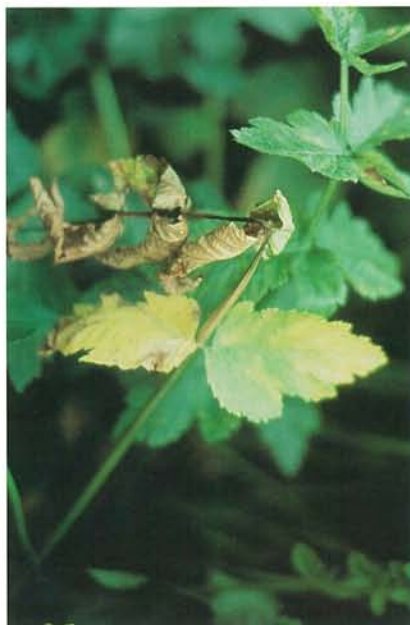
14.6 Phoma du panais; partie supérieure d'un pétiole montrant le symptôme de la «crosse de berger». p. 220