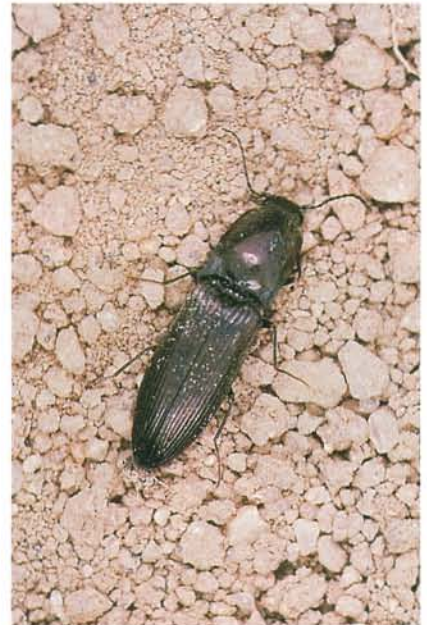
12.54 Ver fil-de-fer; taupin adulte; longueur 3 à 30 mm. p. 195