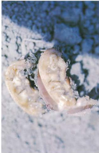
12.50 Mouche des légumineuses; larves et dégâts sur une graine en germination. p. 191