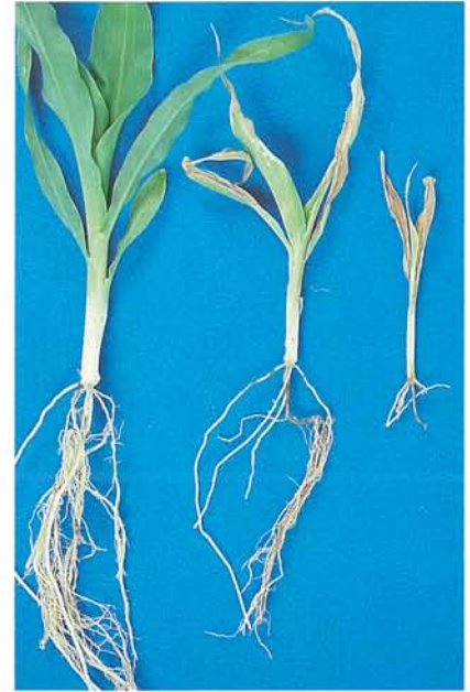
12.19 Dépérissement précoce; dépérissement, pourriture et rabougrissement. p. 181