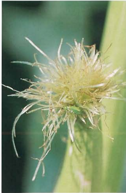
12.33 Chrysomèle des racines du nord; adulte sur les soies du maïs. p. 188