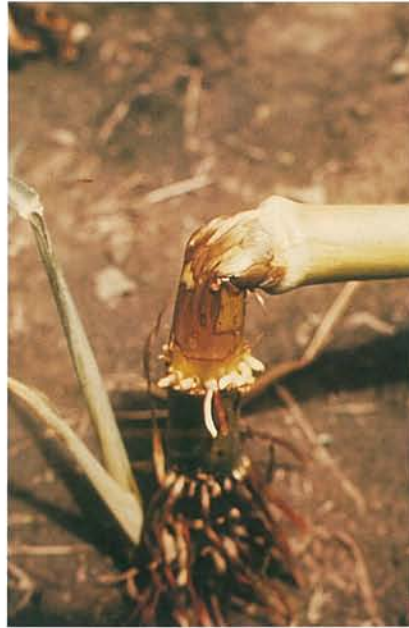
12.18 Pourriture pythienne; une pourriture brun foncé et translucide cause la verse. p. 183