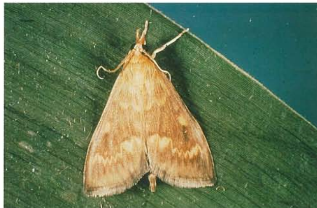
12.42 Pyrale du maïs; adulte; envergure \pm 25 mm. p. 192