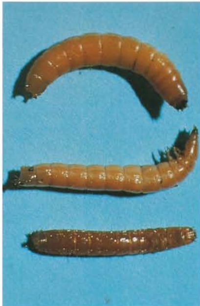
12.53 Ver fil-de-fer; larves. p. 195