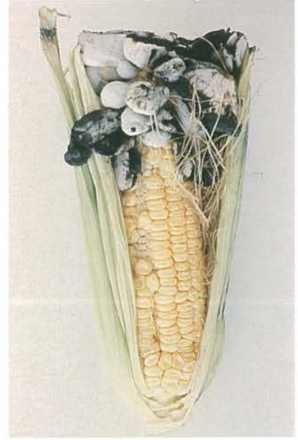
12.11 Charbon commun; tumeurs sur un épi affecté. p. 180