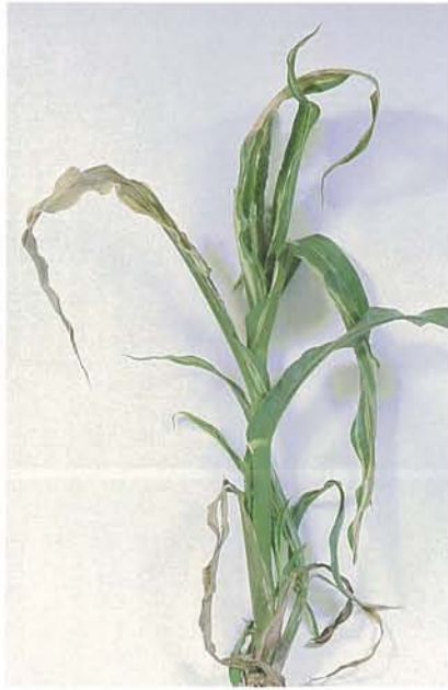
12.2 Maladie de Stewart; plante affectée. p. 179