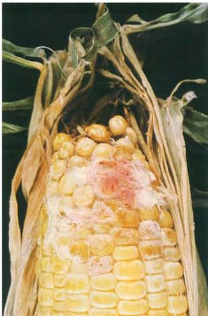
12.6 Fusariose de l'épi; mycélium rosâtre caractéristique du Fusarium graminearum . p. 185