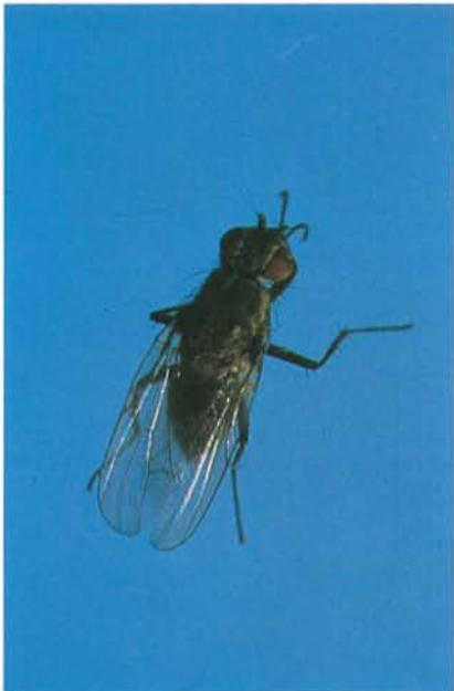
12.52 Mouche des légumineuses; adulte; longueur 7 à 9 mm. p. 191