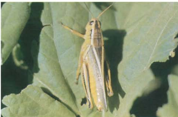
12.55 Criquet birayé; adulte; longueur 25 à 40 mm. p. 195