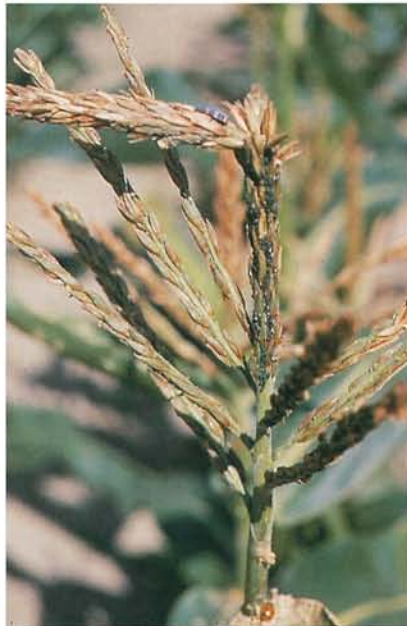
12.37 Pyrale du maïs; panicule brisée; à noter les pucerons et la larve de coccinelle. p. 192