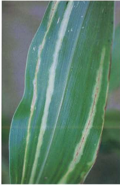
12.1 Maladie de Stewart; les stries vert pâle sur les feuilles virent plus tard au brun. p. 179