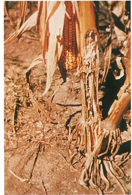
12.15 Pourriture sèche; pourriture brun pâle et sèche de la moelle. p. 183