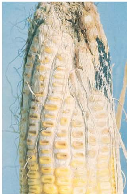
12.7 Pourriture fusarienne des grains; mycélium blanc ( Fusarium ) et périthèces noirs ( Gibberella ). p. 185