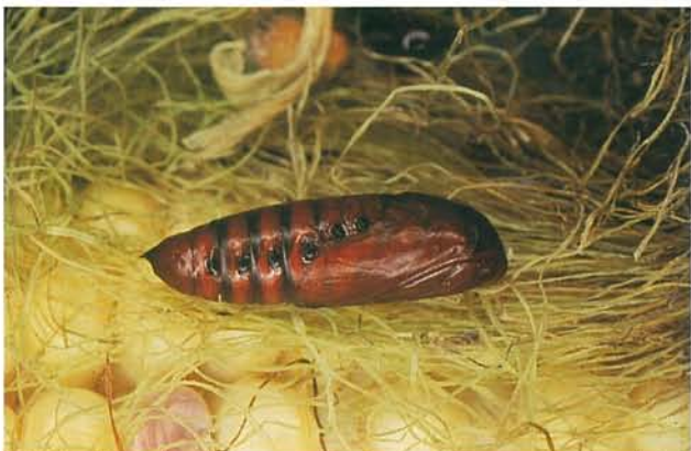
12.47 Légionnaire d'automne; nymphe (que l'on retrouve en général dans le sol). p. 189