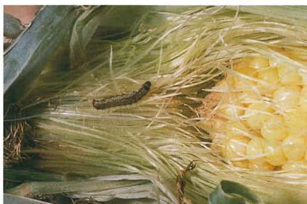
12.44 Légionnaire d'automne; jeune chenille et dégâts sur les soies de maïs. p. 189