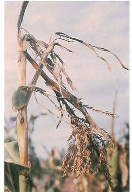
12.38 Pyrale du maïs; tige brisée suite à l'alimentation des larves. p. 192