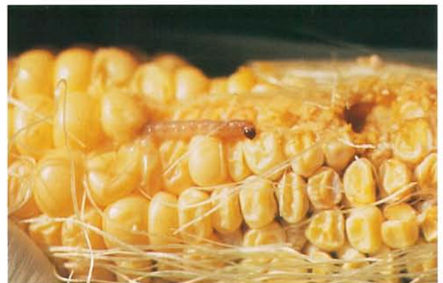
12.40 Pyrale du maïs; larve se nourrissant sur un épi. p. 192