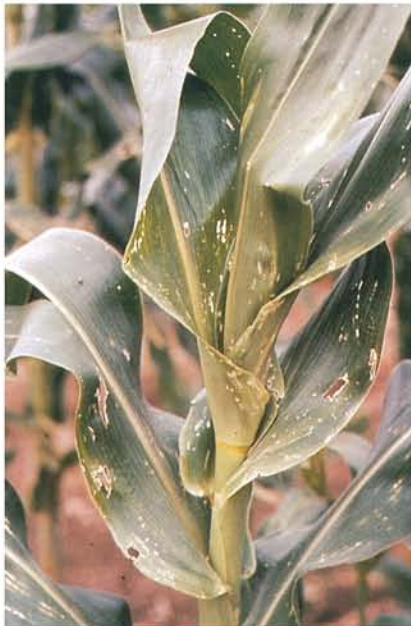
12.36 Pyrale du maïs; dégâts sur les feuilles causés par l'alimentation des larves. p. 192