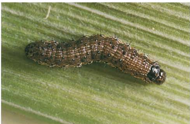
12.45 Légionnaire d'automne; larve à un stade intermédiaire. p. 189