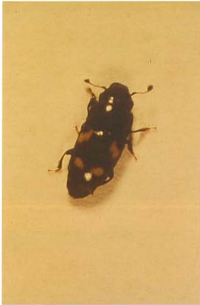
12.49 Nitidule à quatre points; adulte; longueur 4 à 7 mm. p. 191