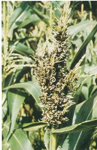
12.13 Charbon des inflorescences; panicules (en forme de balai) affectées. p. 181