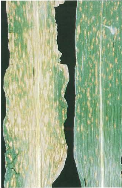
12.9 Kabatiellose; feuilles modérément (à droite) et sévèrement affectées. p. 183