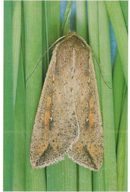
12.27 Légionnaire uniponctué; adulte; envergure \pm 40 mm. p. 190