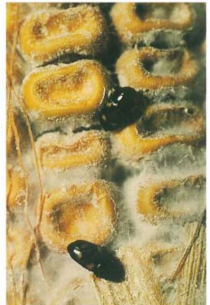
12.8 Pourriture fusarienne des grains; nitidules, vecteurs probables des Fusarium . p. 185