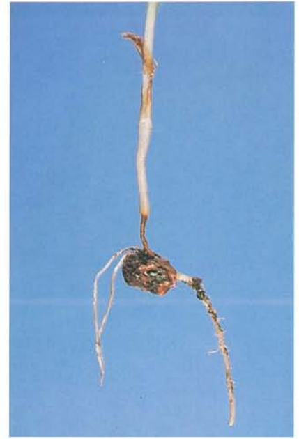
12.4 Fonte des semis; pourriture de la racine et de la graine chez une plantule. p. 182