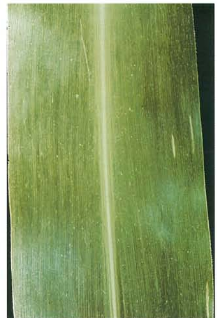
12.24 Mosaïque nanifiante du maïs; symptômes causés par la souche B (= mosaïque de la canne à sucre). p. 187