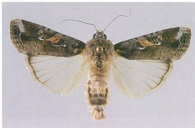
12.48 Légionnaire d'automne; adulte, forme foncée; envergure, 30 à 38 mm. p. 189