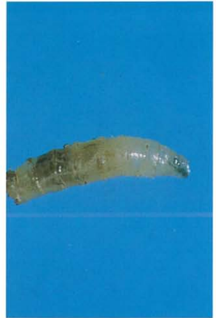
12.51 Mouche des légumineuses; larve. p. 191