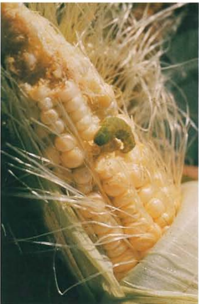
12.30 Ver de l'épi du maïs; larve et dégâts sur un épi. p. 194