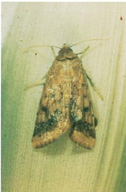
12.31 Ver de l'épi du maïs; adulte; envergure 45 à 65 mm. p. 194