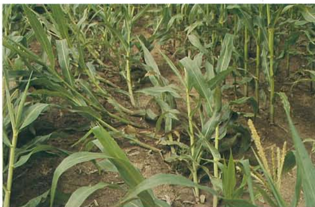
12.39 Pyrale du maïs; verse due à l'alimentation des larves à la base des tiges. p. 192