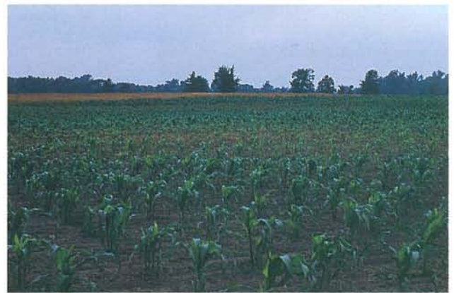
12.5 Fonte des semis et pourriture des racines; zone circulaire de plantes (au centre) souffrant de chlorose foliaire. p. 182