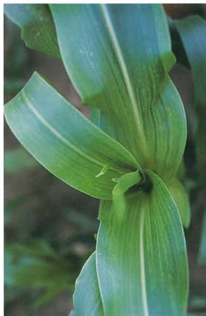
12.23 Mosaïque nanifiante du maïs; mosaïque pointillée et striure vert foncé sur une jeune plante. p. 187