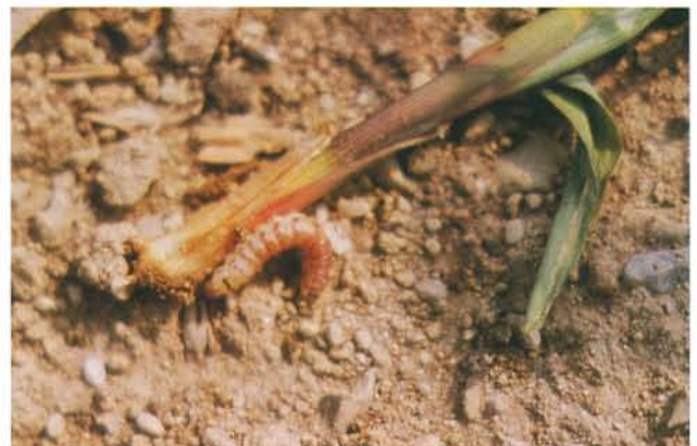
12.56 Perce-tige de la pomme de terre; larve sur une plantule de maïs. p. 195