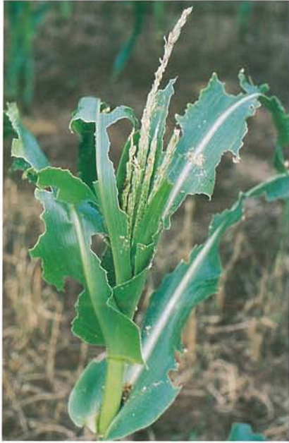
12.25 Légionnaire uniponctué; dégâts sur feuilles de maïs. p. 190