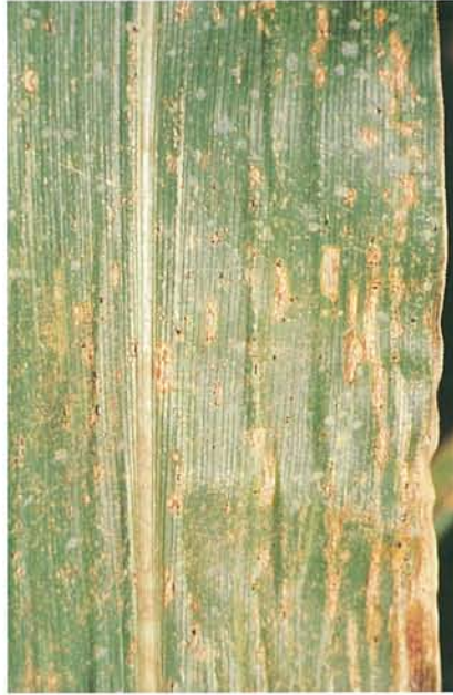
12.10 Rouille; urédies sur une feuille affectée. p. 186