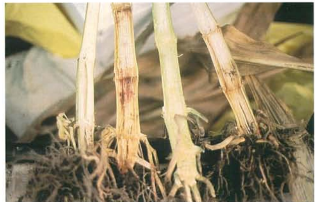
12.16 Fusariose; coloration rose à rouge des tissus de la tige. p. 183