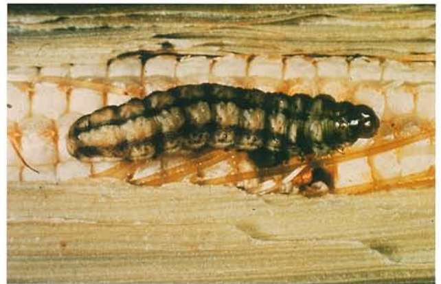
12.29 Ver de l'épi du maïs; larve et dégâts sur un épi. p. 194