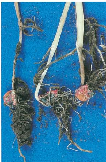
12.22 Dépérissement précoce; à noter l'hypocotyle et les caryopses colonisés par le Penicillium . p. 181