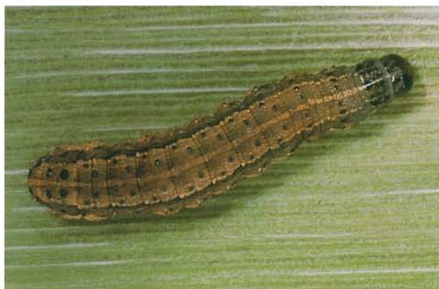
12.46 Légionnaire d'automne; larve à maturité, environ 40 mm de long. p. 189