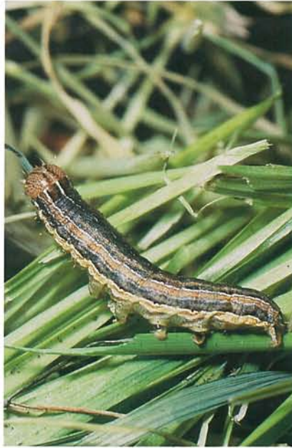
12.26 Légionnaire uniponctué; larve. p. 190