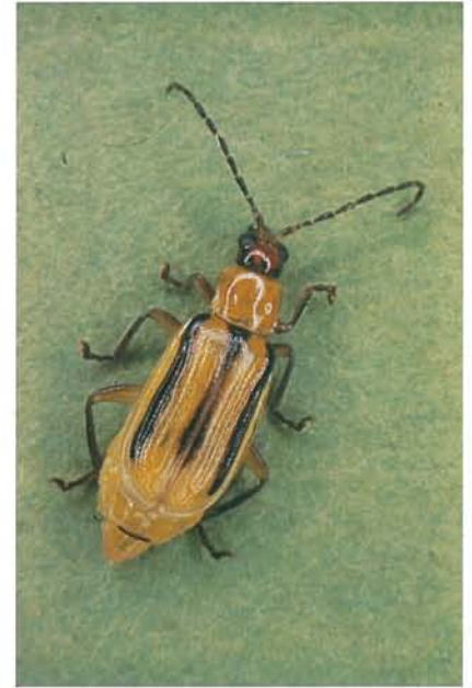
12.35 Chrysomèle des racines de l'ouest; adulte; longueur \pm 10 mm. p. 188