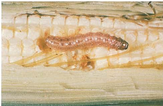
12.41 Pyrale du maïs; larve et dégâts d'alimentation sur des grains. p. 192