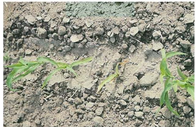
12.21 Dépérissement précoce; plantules plus âgées affectées (à droite, plante saine). p. 181