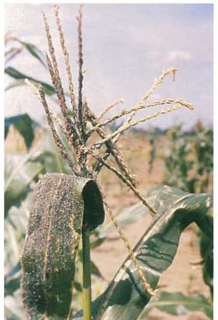
12.32 Puceron du maïs; feuille et panicule infestées. p. 192