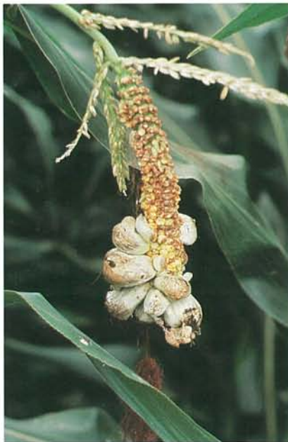
12.12 Charbon commun; tumeurs sur une panicule affectée. p. 180