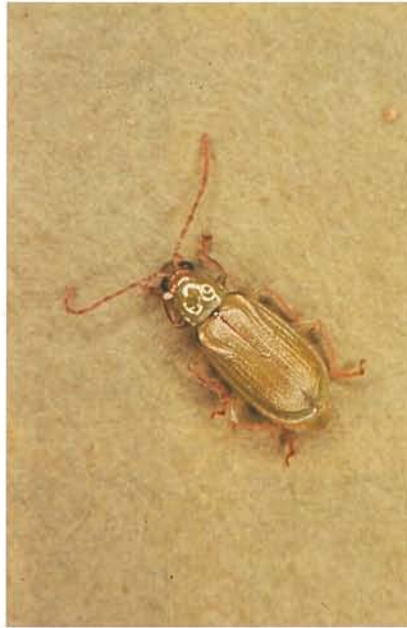
12.34 Chrysomèle des racines du nord; adulte; longueur \pm 10 mm. p. 188