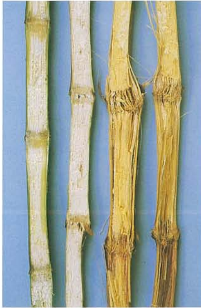
12.17 Fusariose; tiges saines (à gauche) et sévèrement affectées. p. 183