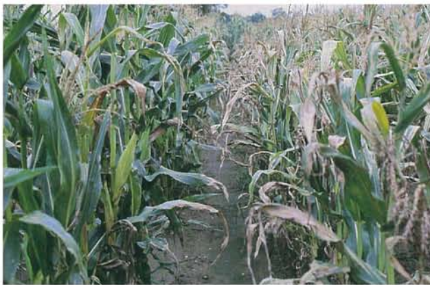
12.3 Maladie de Stewart; plantes sévèrement affectées, en champ. p. 179