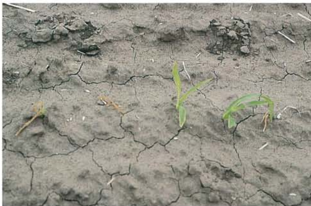
12.20 Dépérissement précoce; plantules mortes et plantules affaiblies. p. 181