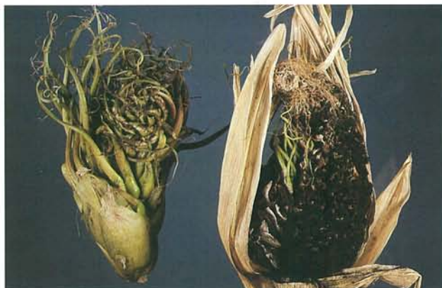
12.14 Charbon des inflorescences; phyllodie (à gauche) et formation de téliosporés sur l'épi. p. 181